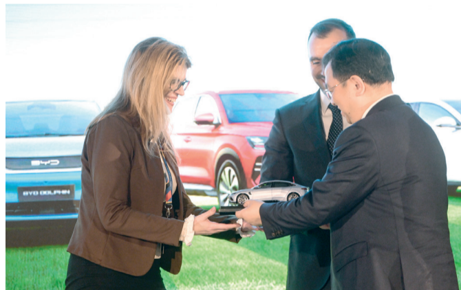
Vang Csuan-fu, a BYD elnök-vezérigazgatója köszöntötte az első magyarországi BYD-tulajdonosokat. Ajándékkal, egy makettel is kedveskedett az első magyar BYD-autótulajdonosoknak a világcég vezetője.

– Bárki bármit mond, hatalmas verseny zajlik a kínai beruházások iránt Európában. Ma Magyarország a kínai beruházások első számú