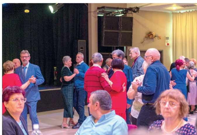
Gyorsan megtelt a táncparkett.