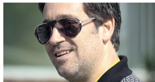
Balásy Gyula cégei a kormány kommunikációs tendereinek kétharmadát nyerték el.

előny. Ennek segítségével Rogán Antal központilag irányíthatja a teljes állami kommunikációt. A G7 megnézte, hogyan alakult a kommunikációs költség az NKOH létrehozása óta. Összesítésük szerint 2015 és 2023 között Rogán Antal 1360 milliárd forintot költött el kommunikációs célokra és rendezvényszervezésre. A portál gyűjtése is megerősíti azt a már jól ismert információt, hogy Balásy Gyula szinte egyeduralkodóvá