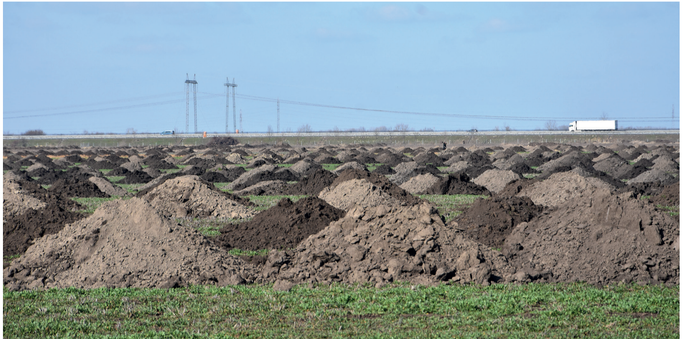
Zajlik a régészeti feltárás az ipari park területén. Ezt is az önkormányzat állja.

Az önkormányzat az ipari fejlesztéshez szükséges munkálatok elvégzése, a lőszermentesítés, a régészeti feltárás és a földvédelmi járulék kifizetése után, a bekerülési értéken adja el az ipari park területét a BYD-nek