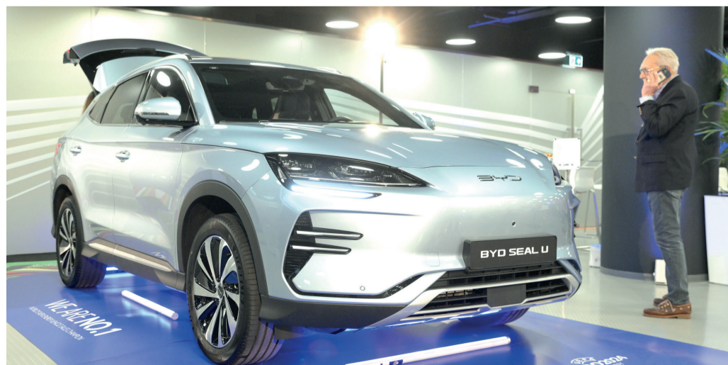
A képen látható BYD Seal U mellett a még tervezés alatt álló, vadonatúj modelleket is Szegeden gyártja majd a BYD.

célpontja. 2020 után tavaly is Kínából érkezett a legtöbb beruházás hazánkba. A szegedi autógyár az ötödik autógyár lesz hazánkban. A BYD nem csak gyárat, bizalmat is hozott, máris nagyon sokan vásárolják az autóikat: a magyar autósok is egyre inkább bekapcsolódnak ebbe a sikertörténetbe – tette hozzá Szijjártó Péter. A külügyminiszter végül azt kívánta, minél hamarabb legyen kész a szegedi gyár.