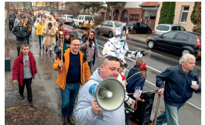
Több százan kísérték el utolsó útjára a dorozsmai boszorkányt.

Fodor Antal önkormányzati képviselő elmondta,