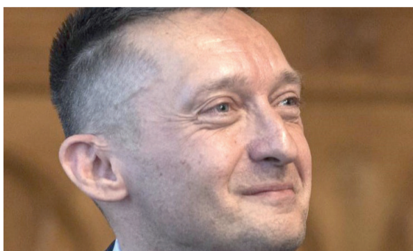
Rogán Antal propagandaminiszter.

Ugyanakkor a totális centralizáció a NER szempontjából hatalmas