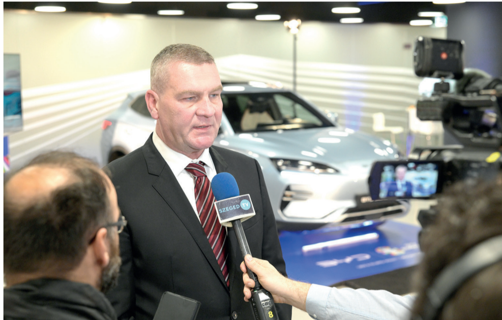
Botka László polgármester elmondta, hogy az első 150 hektárt március végéig, a második ütemet szeptember végéig, a teljes területet pedig az év végéig adja át az ipari parkban az önkormányzat a BYD-nek.

Szijjártó Péter külügyi és külügyminiszter be-