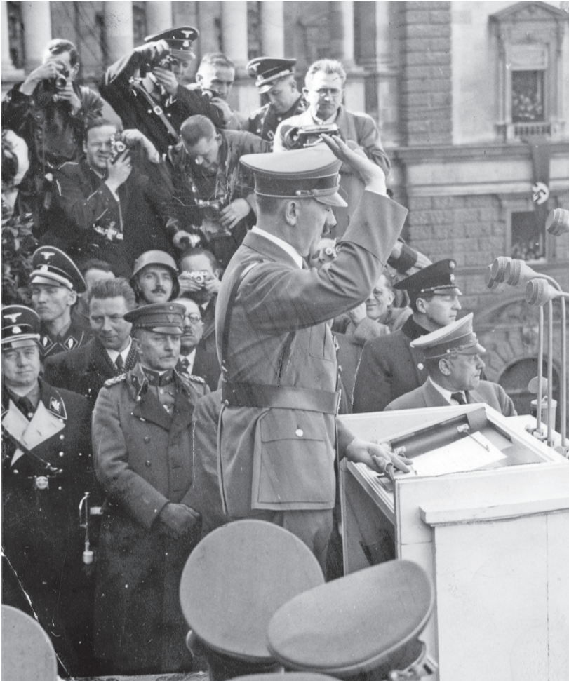
Adolf Hitler beszédet mond három nappal az Anschluss után, 1938. március 15-én, Bécsben.

Karsai László történész a 90 évvel ezelőtti náci hatalomátvételtől