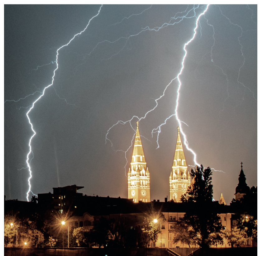
Villámok sújtotta dóm.