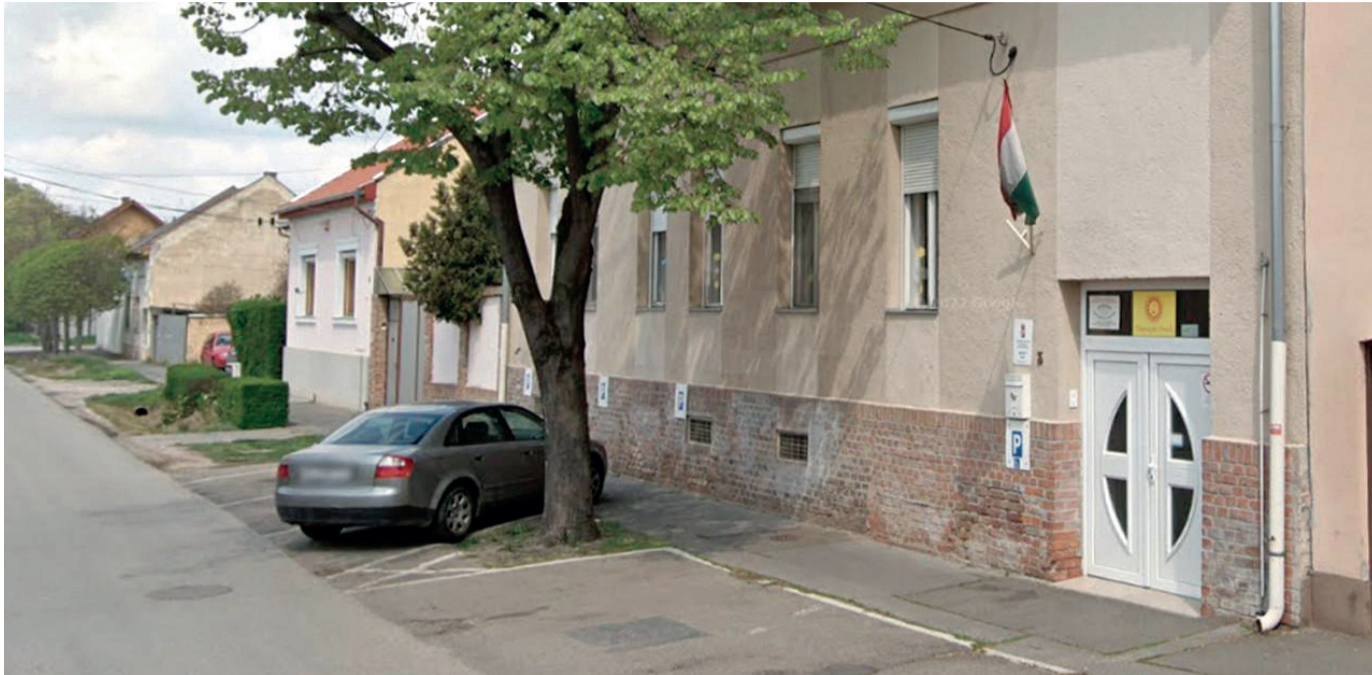
A Szél utcai Napsugár Óvoda épülete.

Szegeden az elmúlt hat évben tizenkettő óvodát újjítottunk fel teljeskörűen uniós támogatással és saját forrásból, és a jövőben is további intézmények szülehetnek újjá – mondta Binszki József alpolgármester a vele készült interjúban. Két óvoda felújítása jelenleg is folyamatban van, egy vadonatúj bölcsőde is épül hamarosan. Néhány városrészben azonban jelentősen csökkent a gyerekszám, emiatt muszáj átszervezni az intézményeket. „Szeptembertől négyvel kevesebb ovi lesz Szegeden, amivel párhuzamosan azonban javulni fog az ellátás színvonala.”