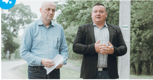
Marad a subasaiak és a sziksóiak bérlete