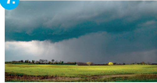
Portré Sütő Máté viharvadásról