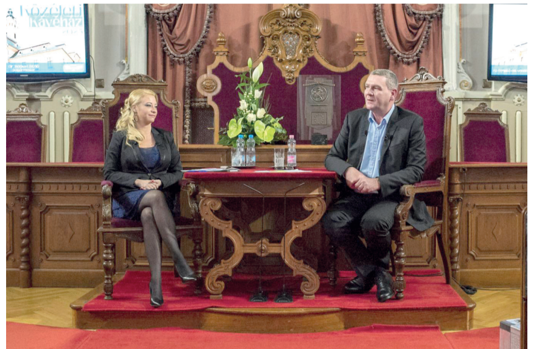
Közvetlen és informatív évértékelőt tartott a városháza dísztermében Botka László polgármester. A beszélgetést Balogh Judit, a Szeged Televízió műsorvezetője moderálta.

Idén jóval kevesebb építkezés lesz, a most fiókban maradó terveket az önkormányzat később valósítja meg. Ugyanakkor az önkormányzati cégek és intézmények, valamint a polgármesteri hivatal ötezer dolgozója közül senkit nem kell elbocsátani. A polgármester hozzátette: sokakat kaptak a Lázár János-féle építésválság-tervezettől,