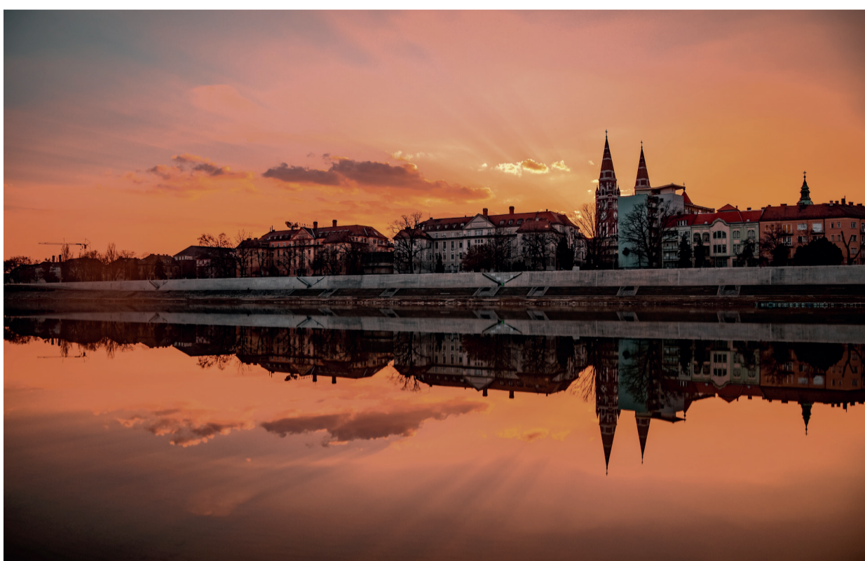
Itt nem készülődtött vihar, de a gomolyfelhők megtörték a napsugarakat, és a magasban a párán, az apró jégkristályokon átfutó sugarak tyndallt alkottak.