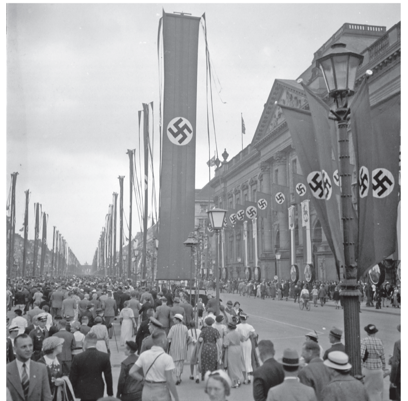
Berlin nevezetes sugárútja 1936-ban. Háttérben a Brandenburgi kapu.

– 2014 nagyon riasztó volt, amikor mindenki szó nélkül lenyelte, talán még az ukránok egy része is, a Krím félsziget elcsatolását. Tavaly februárban, amikor megindult a „dicsőséges, felszabadító orosz hadsereg”, akkor Európa összezárt, Amerika is fegyvert és pénzt kezdett adni. Ez már egy más világ. Az elmúlt év tapasztalatai alapján az, hogy Amerika és Európa kitarthat Ukrajna mellett, olyan csapás Oroszországnak, Putyinnak és minden más diktátornak, ami lehet akár egy új, még jobb világ kezdete is.