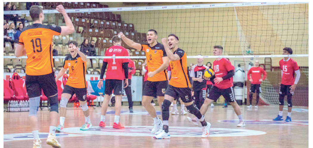
Menetel a szezonban a narancssárga mezes Vidux-Szegedi RSE.

A Vidux-Szegedi RSE 10 mérkőzésen szerzett 26 pontot visz magával a középszakaszba, ahol a Dág, a MEAFC-Miskolc és a Dunaújváros lesz az ellenfele.