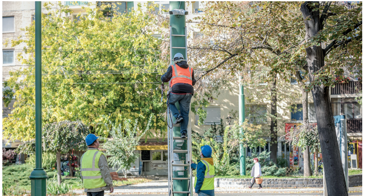
Biztonságosabbá tették a Csillag teret a térfigyelő kamerákkal.